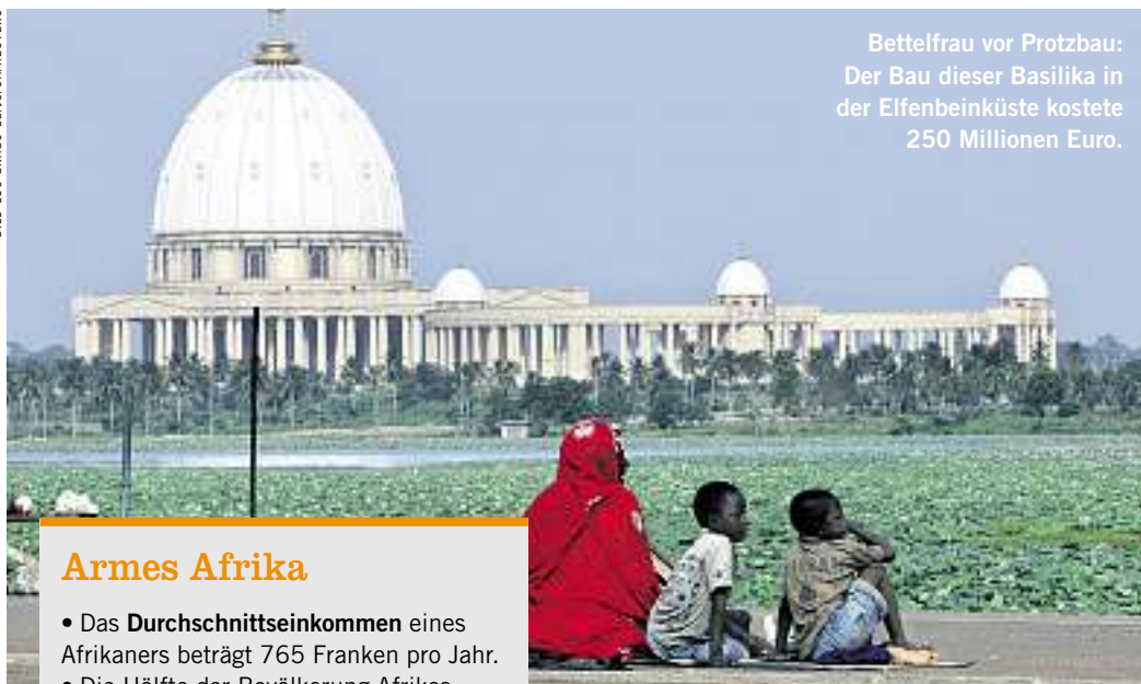
Bettelfrau vor Protzbau: Der Bau dieser Basilika in der Elfenbeinküste kostete 250 Millionen Euro.